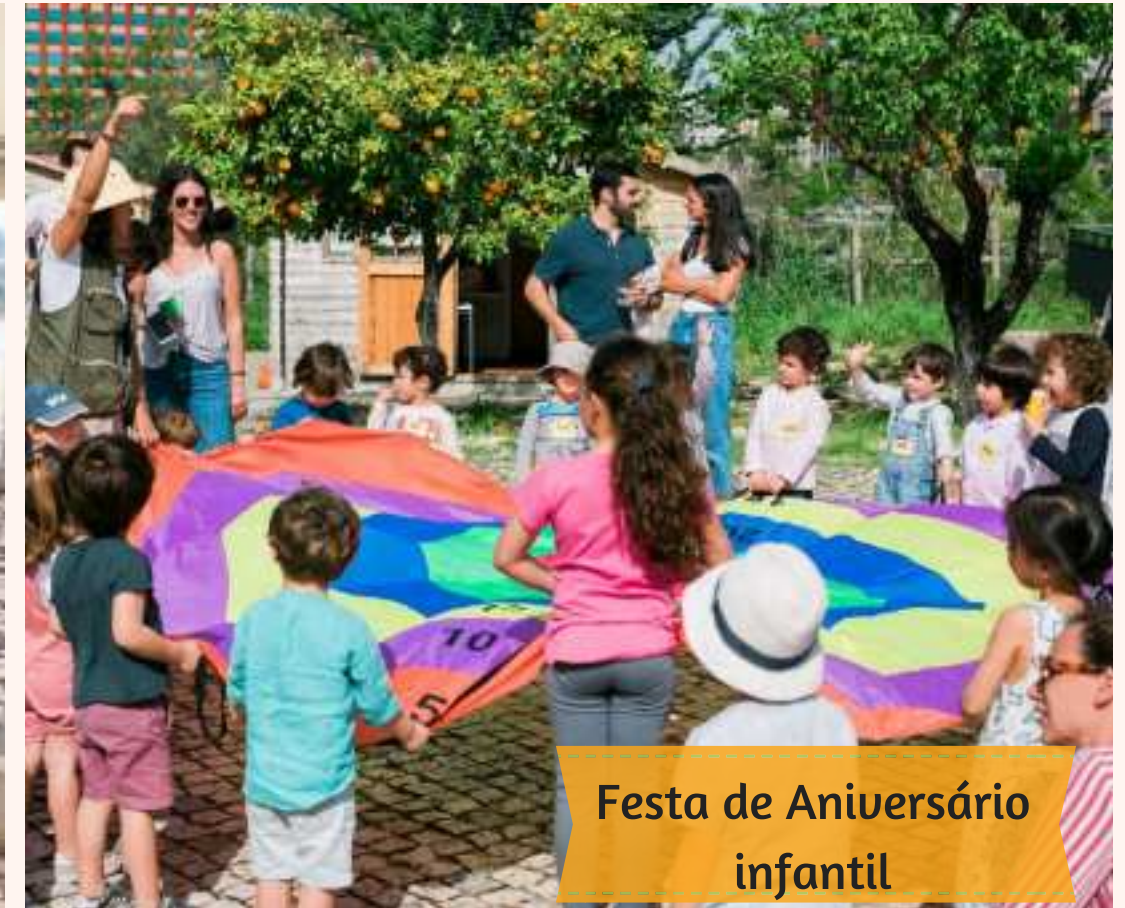
Festa de Aniversário infantil