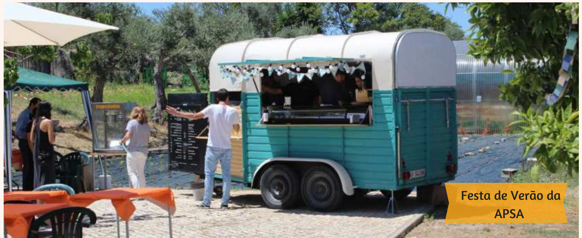
Festa de Verão da APSA