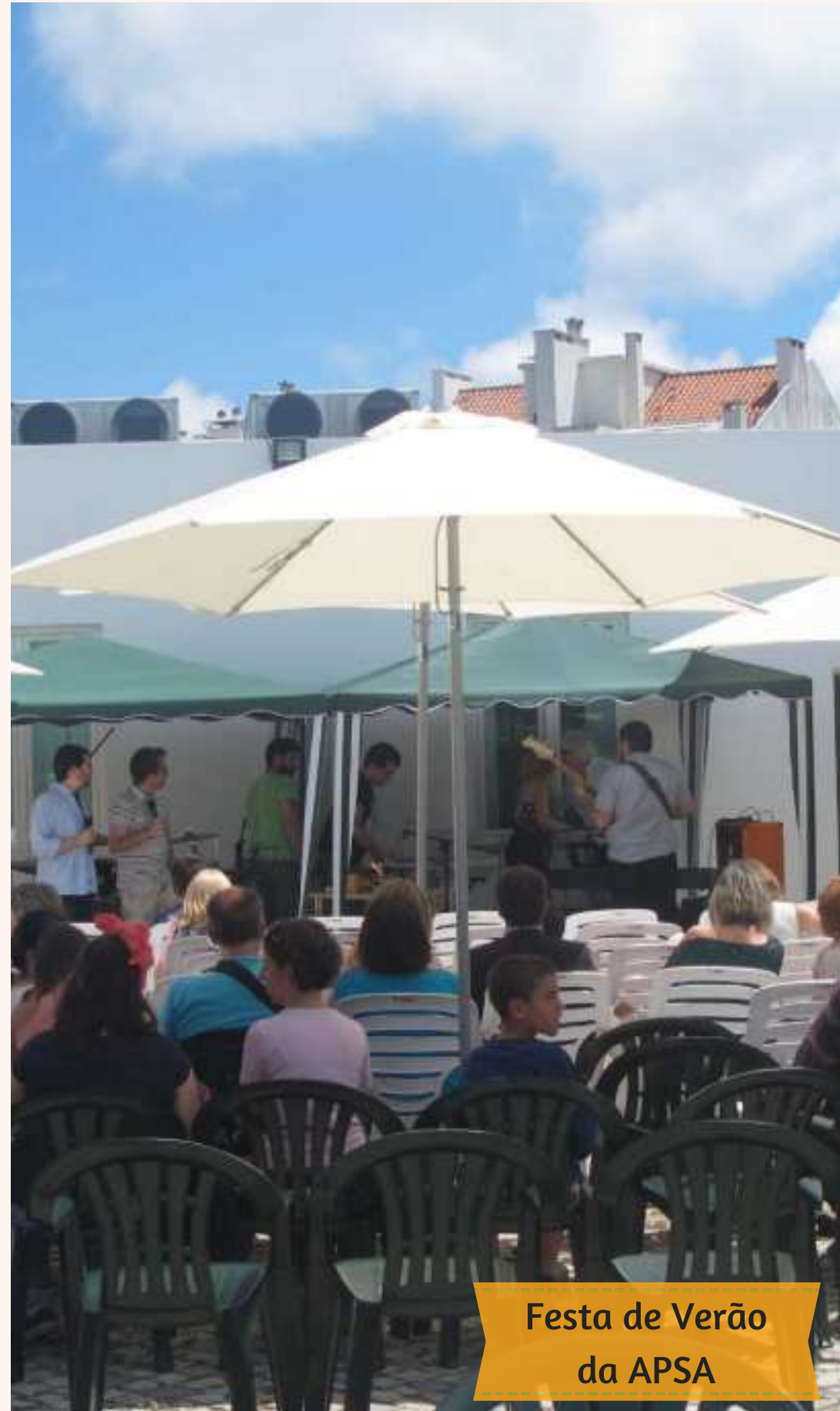
Festa de Verão da APSA