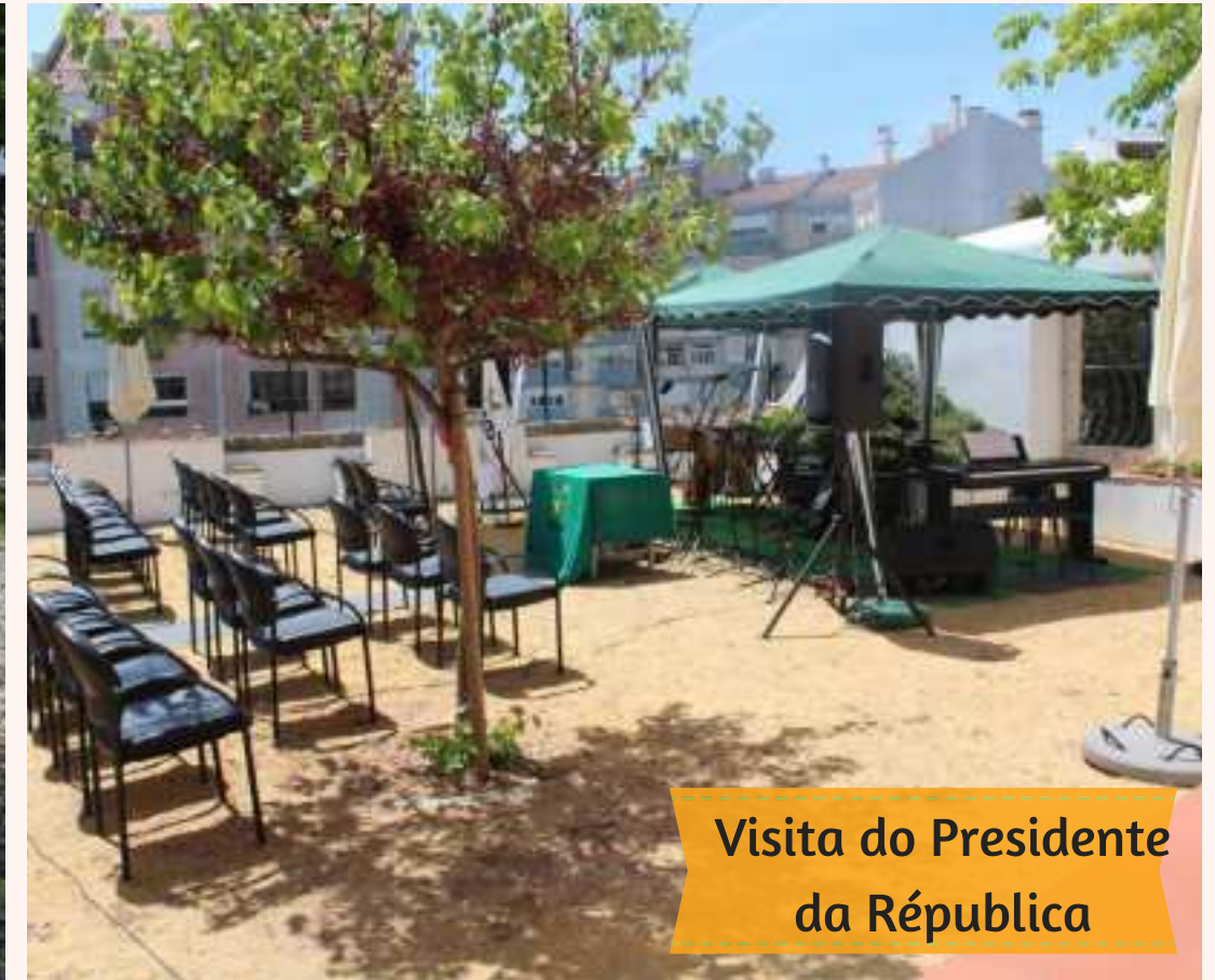
Visita do Presidente da República