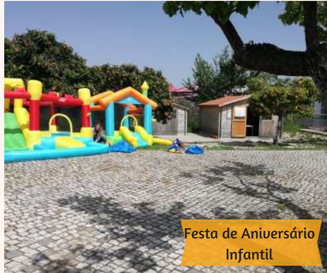
Festa de Aniversário Infantil