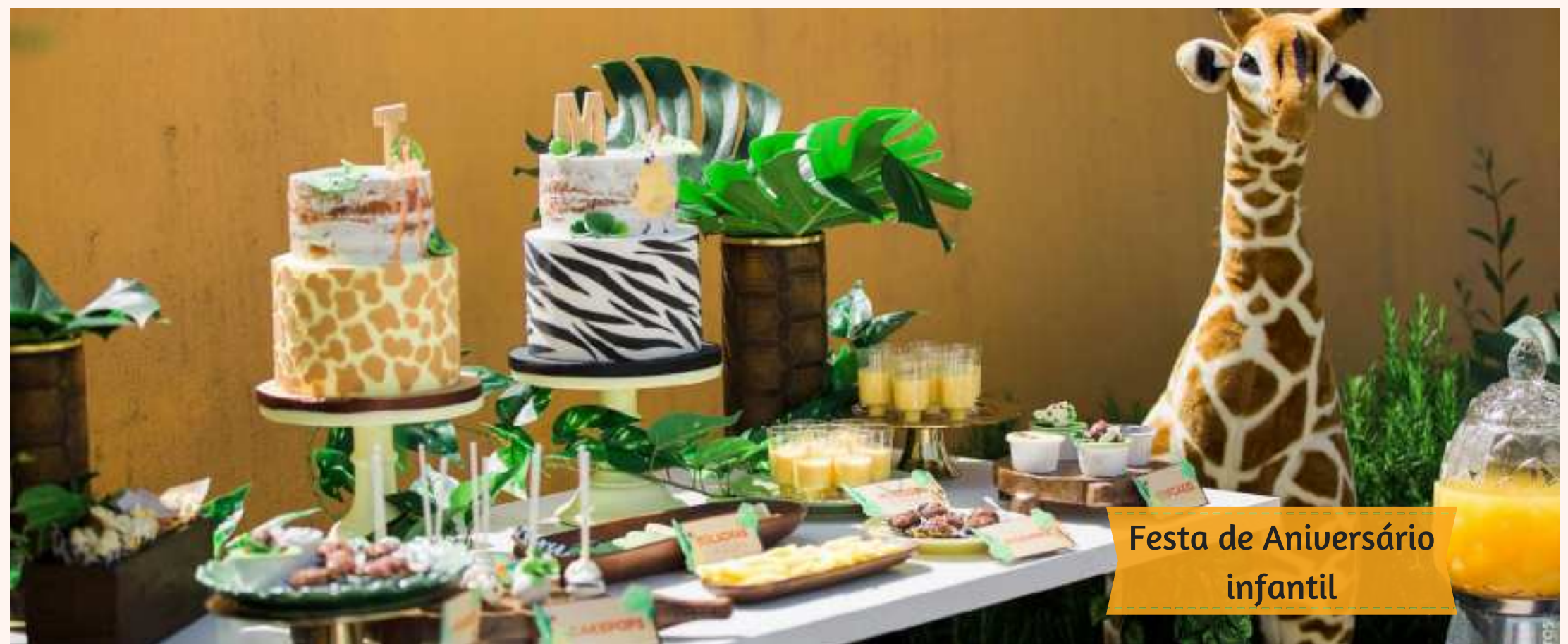
Festa de Aniversário infantil