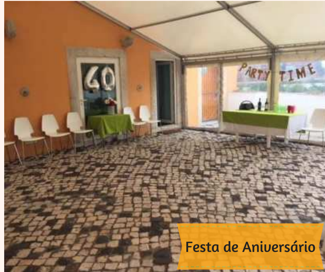
Festa de Aniversário