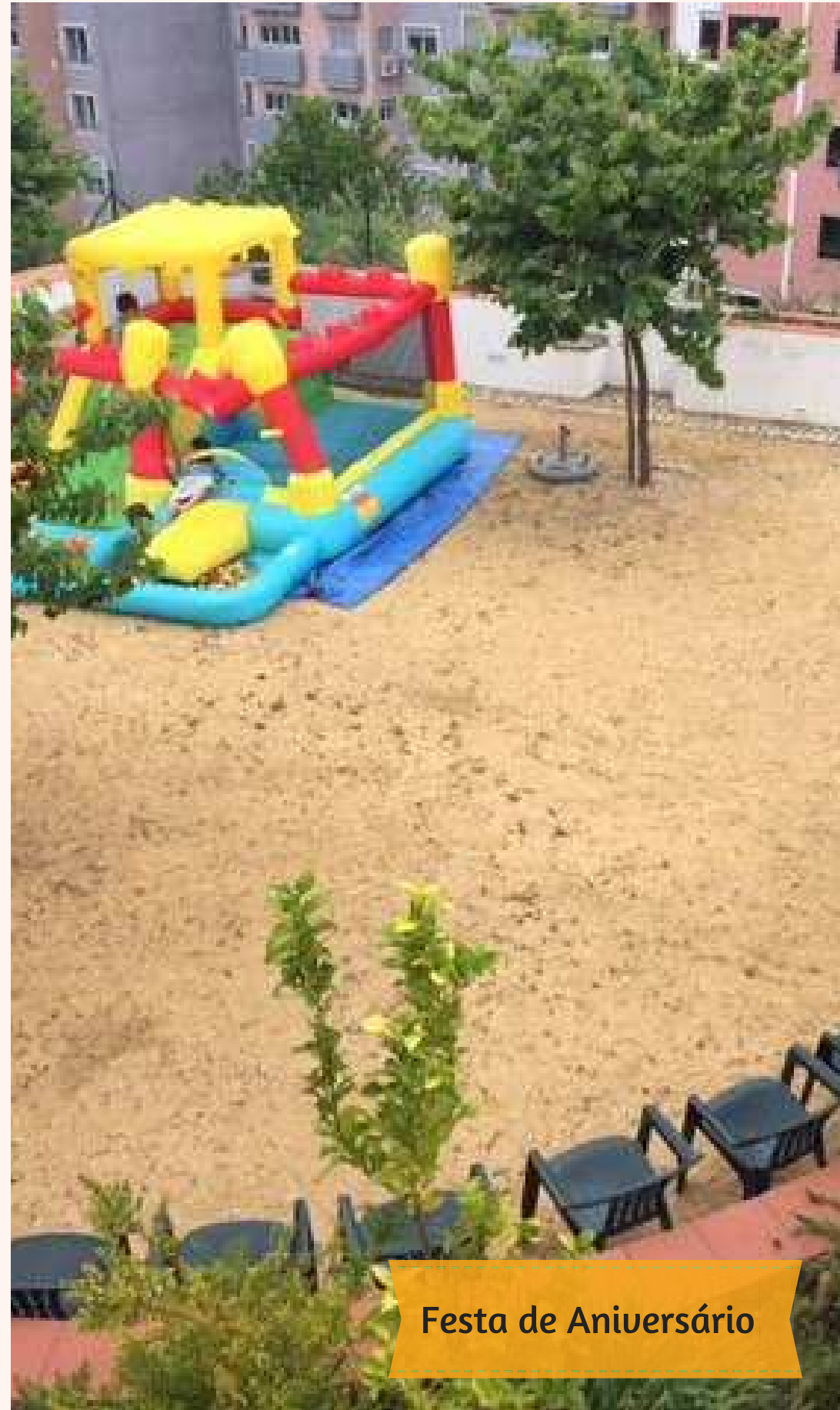
Festa de Aniversário